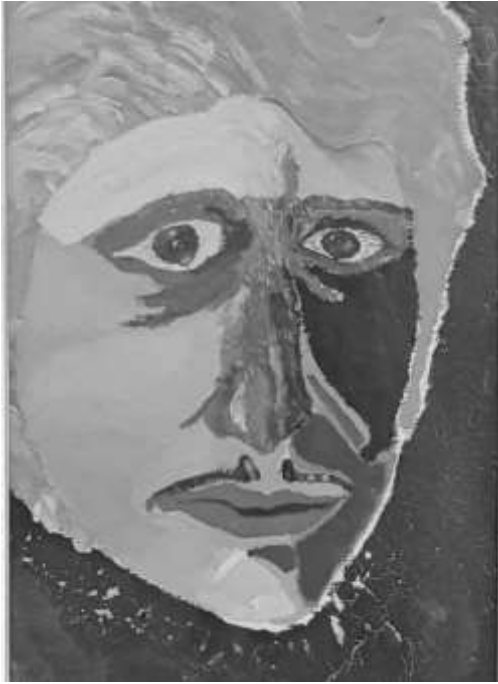
Autoportret, 1981 (tratat în alb-negru)

nimic nu-i mai aproape de neant decât iluzia – și nimic nu-i mai departe de neant decât iluzia • intensifică-ți iluzia – păstrându-ți discernământul – apoi tai-o și treci dincolo •